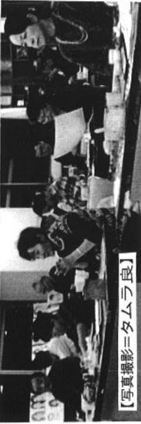
【写真撮影】タムラ良